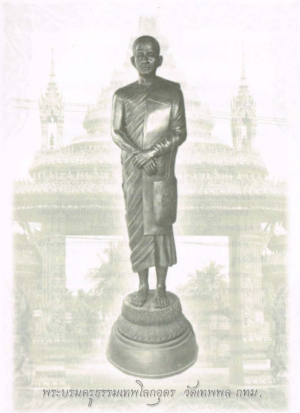
พระบรมครูธรรมเทพโลกอุดร วัดเทพพล กทม.