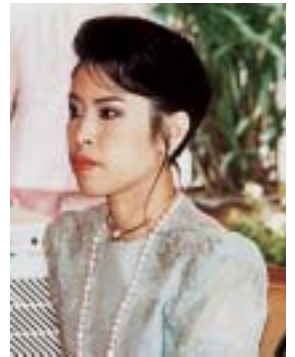
พระเจ้าลูกเธอ เจ้าฟ้าหญิง จุฬาภรณวลัยลักษณ์ อัครราชกุมารี