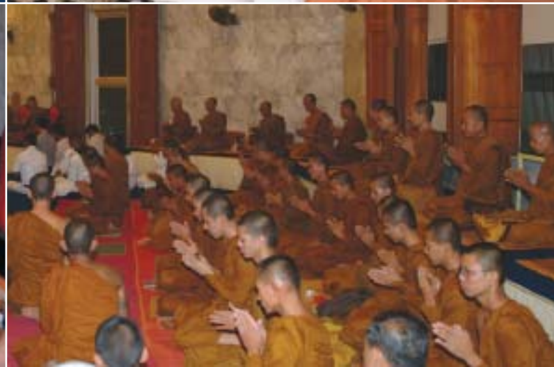
๑. ที่บศพลวงปู่ ประดับดอกไม้อย่างงดงาม ๒. พวงมาลาพระราชทานของสมเด็จพระนางเจ้าฯ พระบรมราชินีนาถ และสมเด็จพระเจ้าฟ้าจุฬาภรณวลัยลักษณ์ ๓-๕. พระเทพสารเวที พระเลขาธุการส่วนพระองค์ในสมเด็จพระสังฆราชฯ เป็นประธานในพิธีสวดพระอภิธรรม