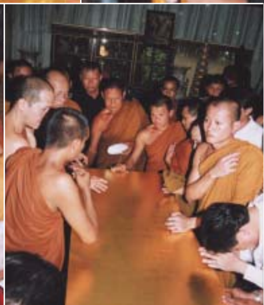
๑. น้ำหลวงพระราชทานสรงศพ ๒. พระบาทสมเด็จพระเจ้าอยู่หัว ทรงพระกรุณาโปรดเกล้าฯ ให้พลเอกนพ พินสายนแก้ว เป็นผู้แทนพระองค์ อัญเชิญน้ำพระราชทานสรงศพ ๓.-๘. คณะศิษย์ร่วมกันเคลื่อนศพหลวงปู่ลงสู่โลงทอง