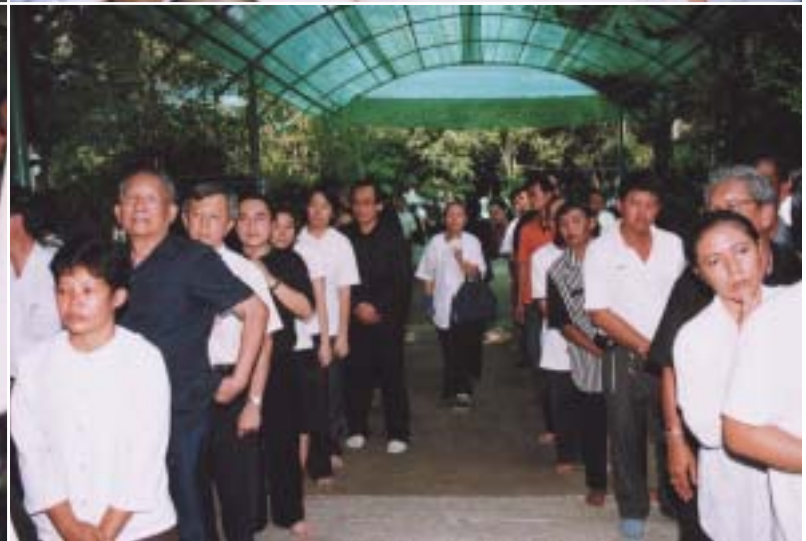
๑.-๒. พระเทพสารเวที พระเลขาฯการส่วนพระองค์ในสมเด็จพระสังฆราชฯ เป็นผู้แทนพระองค์นำน้ำสรงศพและถวายผ้าไตร ๓.-๖. คณะศิษย์จากทุกทิศ มาร่วมในพิธีสรงน้ำศพ