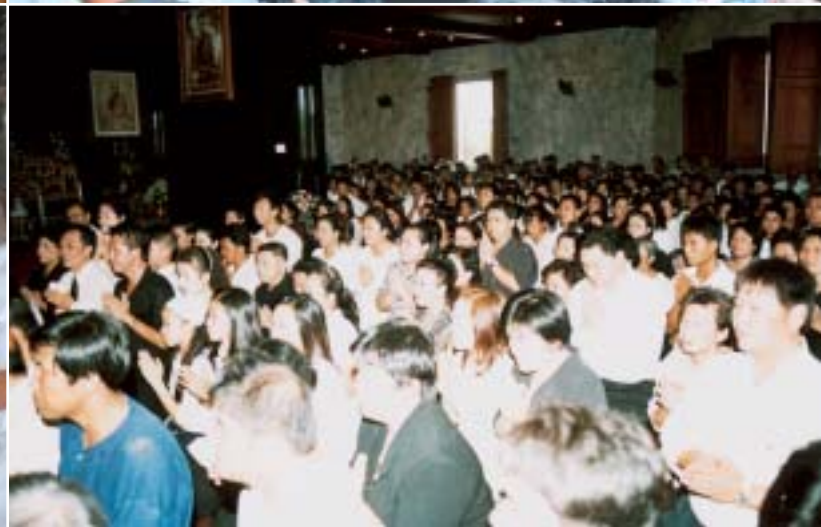
๑-๖. บรรดาศิษย์กล่าวขอขมาหลวงปู่