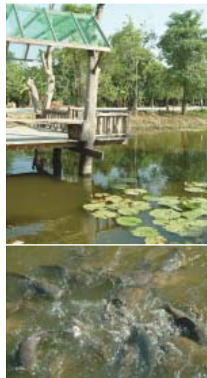
ศาลาทำน้ำที่หลวงปู่ ไปให้อาหารปลาตอนเย็น