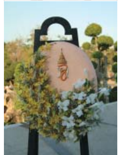
สมเด็จพระนางเจ้าสิริกิติ์ พระบรมราชินีนาถ และสมเด็จพระเจ้าลูกเธอ เจ้าฟ้าจุฬาภรณวลัยลักษณ์ อัครราชกุมารี ทรงพระกรุณาโปรดเกล้าฯ พระราชทานพวงมาลาหน้าหีบศพ