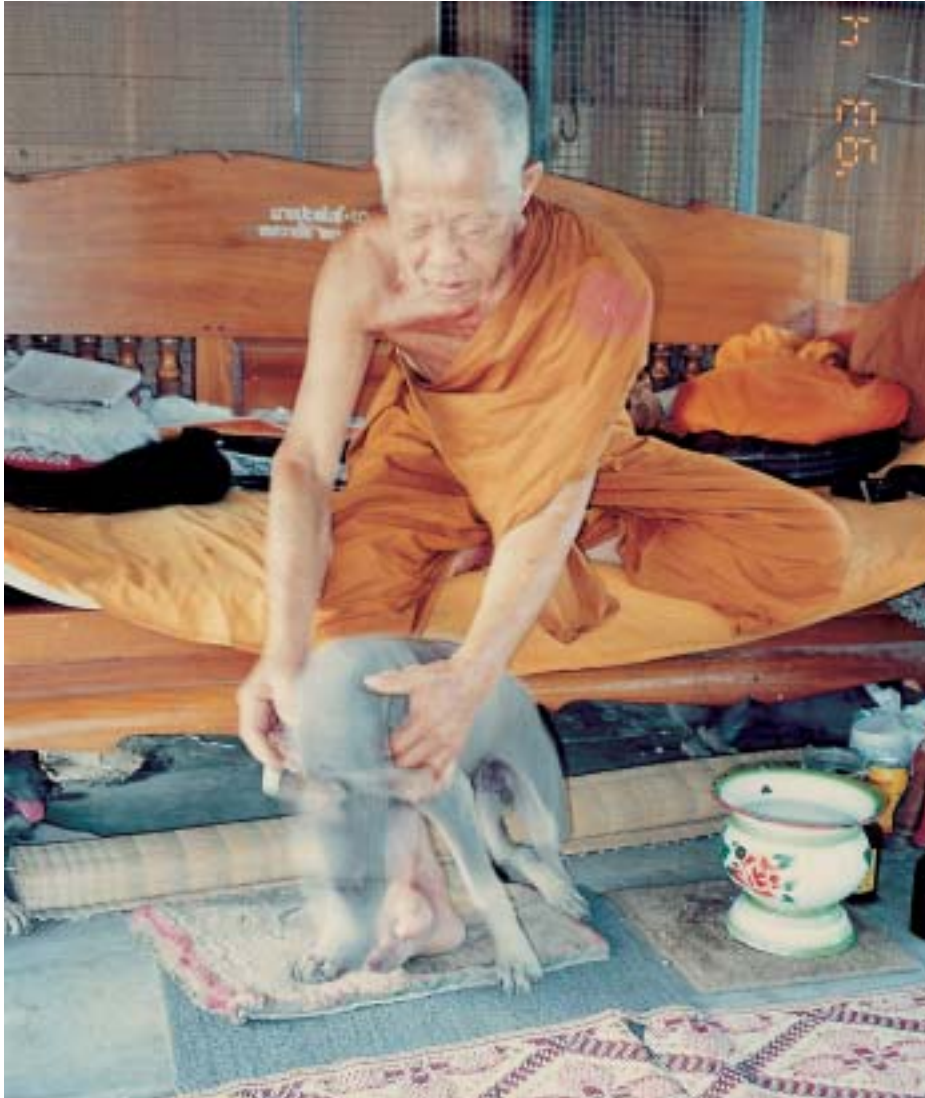
หลวงปู่เจี๊ยะชอบเลี้ยง หมาไทยหลังอาณ