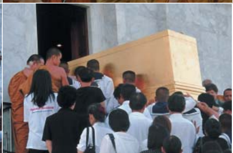
๑-๗. เชิญศพหลวงปู่ขึ้นสู่กุฏิที่ตเจดีย์