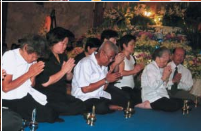
ส่วนหนึ่งของญาติโยมและสาธุศิษย์ที่ร่วมกันเป็นเจ้าภาพในพิธีสวดพระอภิธรรม ซึ่งมีเป็นประจำทุกคืน น้องๆหลวงปู่เจี๊ยะก็มาร่วมด้วย