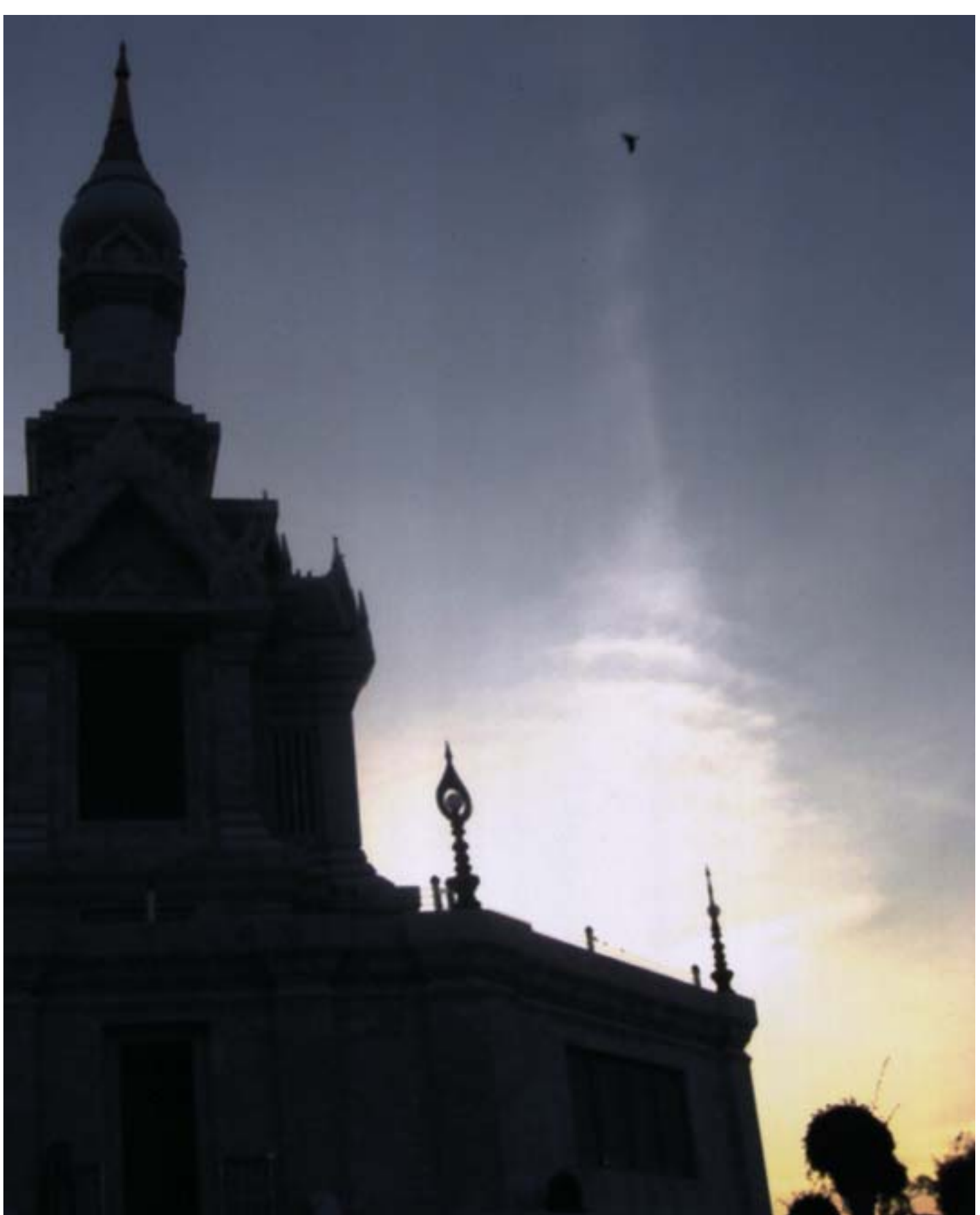
วันเคลื่อนศพจากกุฏิขึ้นสู่กุฏิวัดตเจดีย์ เกิดเงาเมฆก่อตัวเป็นรูปเจดีย์บนท้องฟ้า