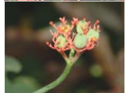
ดอกไม้ในวัด